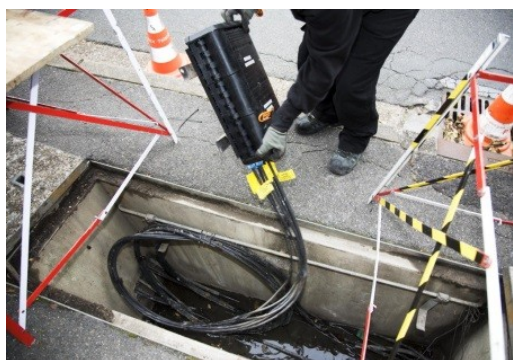
Raccordement dans la rue