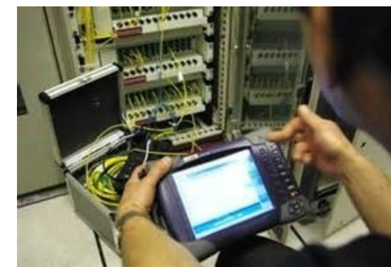
Contrôle et mesure