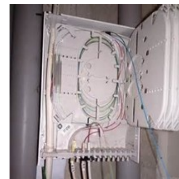
Raccordement chez l'abonné